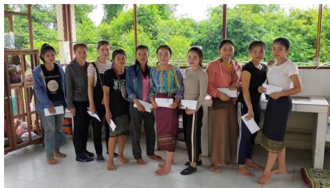
Les jeunes filles lors de leur arrivée à l'école technique

Un premier cycle de trois mois a démarré début août. Après le bilan de ce trimestre, un second cycle ouvrira en décembre.